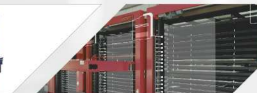
板材自動倉儲設備6座