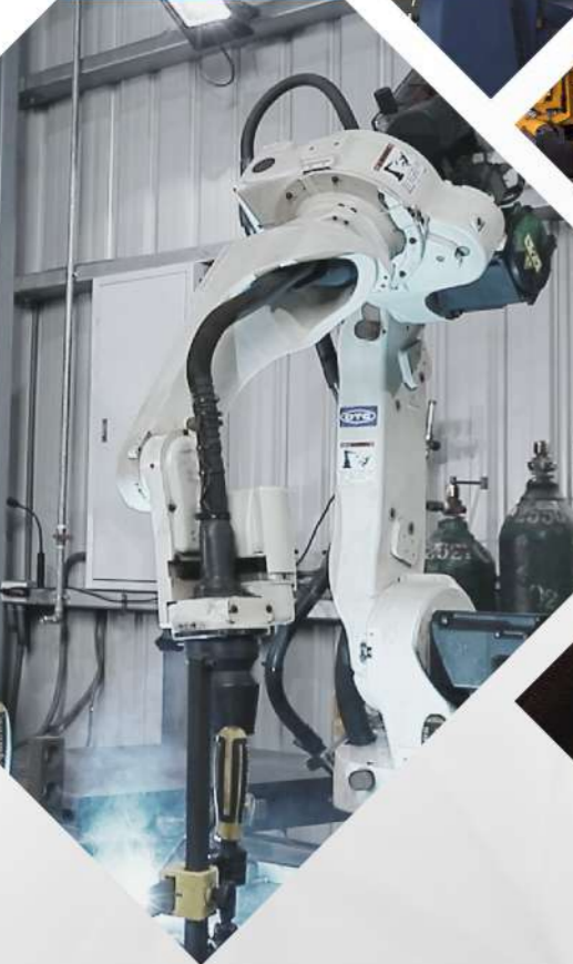
Robot 自動焊接手臂 數台