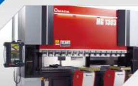
AMADA-HG13031台 與 AMADA 折床數台