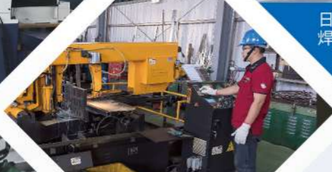
全自動 6235- 大型鋸床