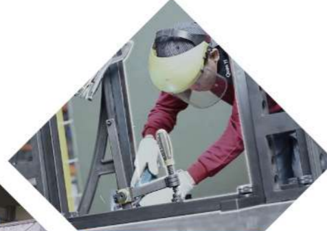
日本OTC 焊接設備 10套